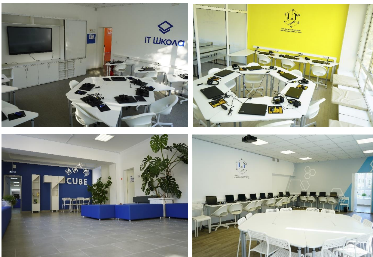
Центр цифрового образования детей «IT-куб» Муниципальное бюджетное образовательное учреждение дополнительного образования «Гуманитарный центр интеллектуального развития» городского округа Тольятти»